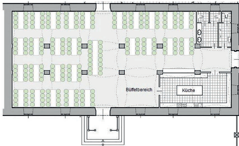
Marstahl rechteckige Tische á 8 Personen

27 Tische á 8 Personen = 216 1 Tafel 16 Personen = 16 232 Personen